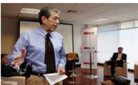
miércoles 30 mayo 2018