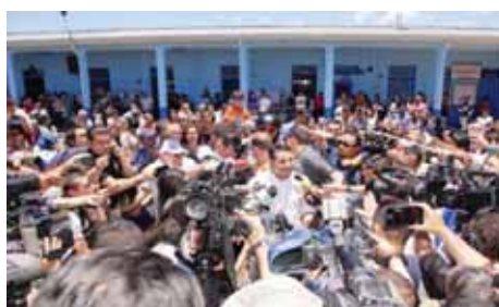
miércoles 30 mayo 2018