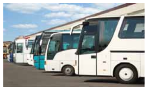
miércoles 30 mayo 2018