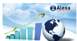
Ranking de Webs Oficiales de Turismo a octubre 2014