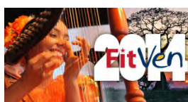
Barinas prepara su mejor atuendo para la FitVen 2014