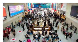
Más de 200 nuevos expositores revelan la vibrante variedad de WTM 2014