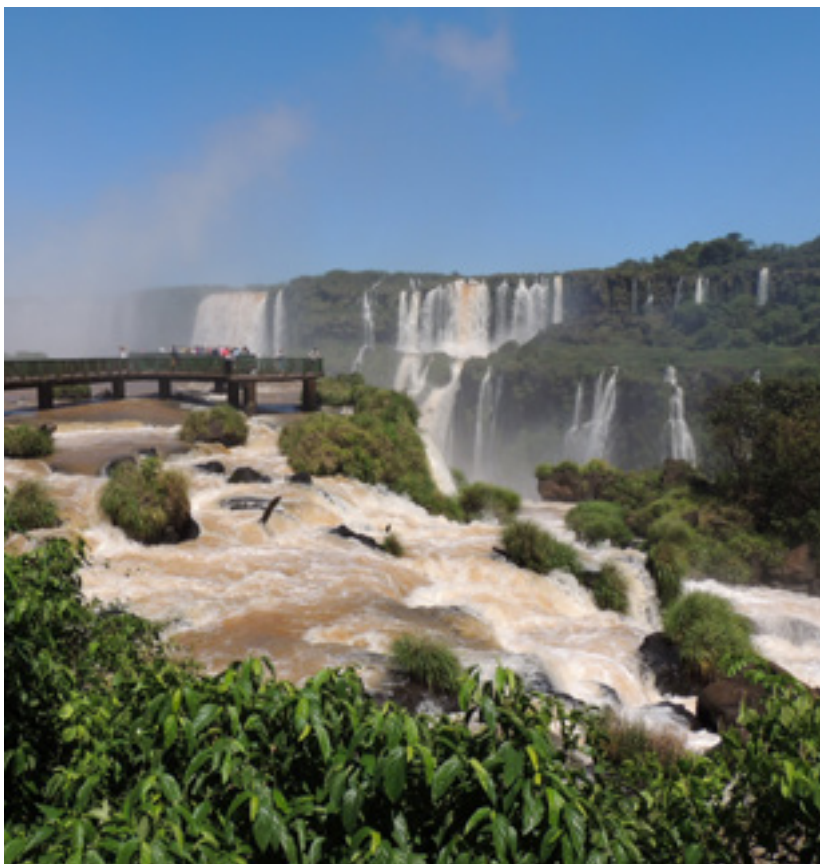
Cataratas Foz do Iguazu

La celebración de la feria en Brasil servirá también para reforzar la presencia de Brasil en Termatalia y para promocionar a través de ella a Ourense y Galicia como destinos termales. España es el cuarto mercado receptor de turistas de este país que supera los 200 millones de habitantes. Según datos de Canadian Travel & Tourism, se estima que en 2018 la cifra de brasileños que realicen viajes al exterior llegue a los 11,3 millones. Por otro lado, España es el noveno país emisor de turistas a Brasil.