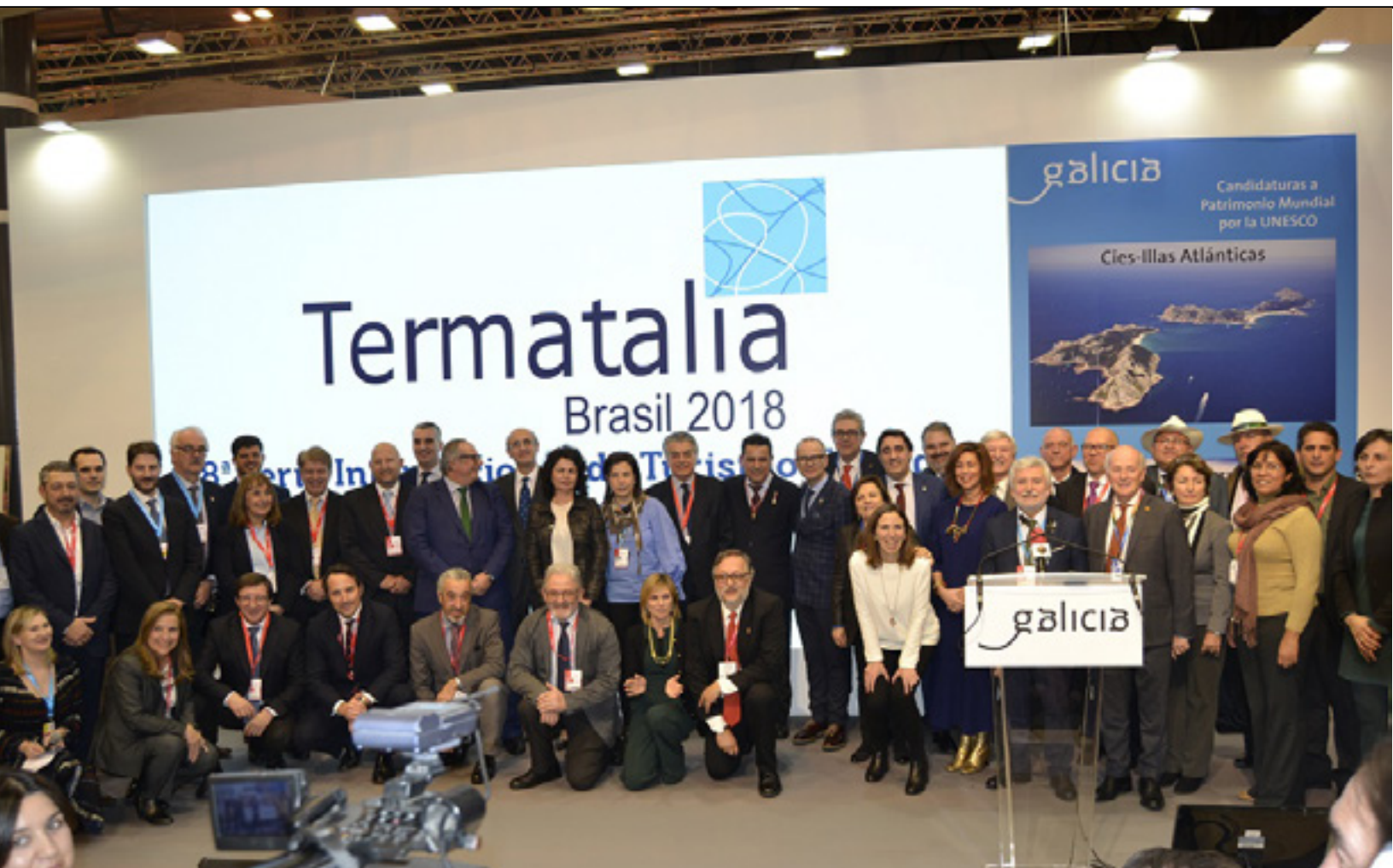
Altas autoridades de Termatalia en su presentación en FITUR 2018 en Madrid