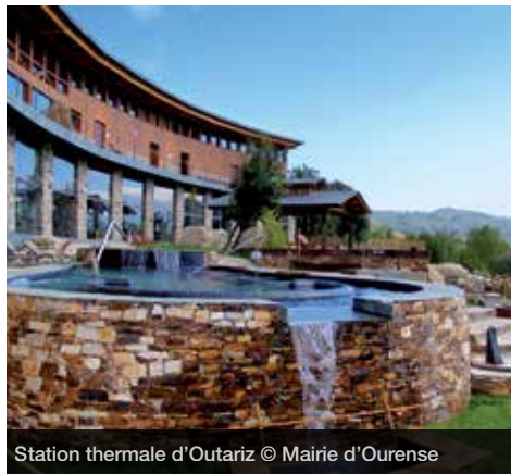
Station thermique d'Outariz

Eaux thermales, histoire et nature se confondent à Ourense afin de créer une destination touristique de bien-être à caractère urbain, dont l'exploitation est récente.