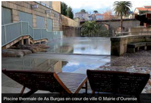
Piscine thermique de As Burgas en cœur de ville