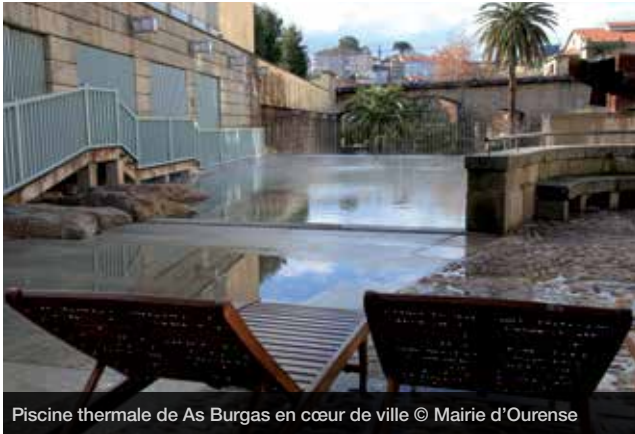
Piscine thermale de As Burgas en cœur de ville