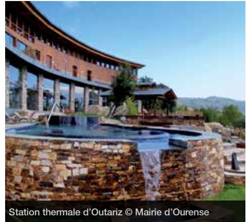
Station thermale d'Outariz

Eaux thermales, histoire et nature se confondent à Ourense afin de créer une destination touristique de bien-être à caractère urbain, dont l'exploitation est récente.