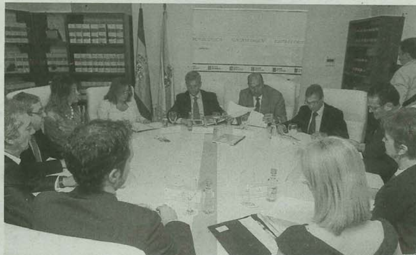
Alfonso Rueda y Rogelio Martínez durante la reunión de ayer con los jefes territoriales.

Y eso que el propio Rueda destacó, durante la rueda de prensa posterior a la reunión, el importante ahorro -más de 600.000 euros- conseguido en los últimos cinco años gracias a la reducción de alquileres para servicios de la Xunta, "esto en una provincia como Ourense con una especial dispersión y el mayor número de ofi-