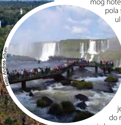
Slapove Iguazu hrle vidjeti turisti iz cijeloga svijeta

mog hotela Vivas Cataratas nekih pola sata vožnje glavnom ulicom. Kad sam se ujutro malo odmorila, zamolila sam recepciju da mi nazove taksi koji će me odvesti do hotela u kojem se održava konferencija. Taksi je stigao u samo nekoliko minuta. Očekivala sam da će iz hotela skrenuti lijevo i glavnom ulicom doći do mog odredišta, ali vozač je krenuo nekim drugim putem.