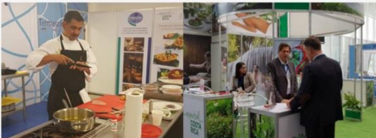
• Expositores internacionales en Termatalia

Mientras que Grupo Barceló expuso los cuatro hoteles que hay en el país, los cuáles ofrecen bienestar como el Langosta, Tambor, Occidental Papagayo y Barceló San José.